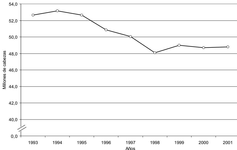
Gráfico 1. Existencias bovinas. Total nacional

Las existencias totales de ganado bovino ascienden a 48,9 millones de cabezas al 30 de junio del año 2001 (Gráfico 1). La evolución del stock en el último trienio se mantiene así prácticamente estable en torno a los 48-49 millones.